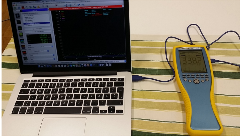
Kuva 3. Spectran NF-5035 ja MCS-ohjelma

Spectran NF-5035 spektrianalysaattoria voi käyttää joko yksinään käsimittarina tai tietokoneeseen yhdistettynä, jolloin MCS-ohjelmaa käyttämällä mittarista saa helppokäyttöisemmän spektrianalysaattorin paremmilla tallennusominaisuuksilla.